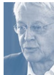
Charles Kleiber, ehemaliger Staatssekretär für Bildung und Forschung und ehemaliger Direktor der Abteilung öffentliches Gesundheitswesen im Kanton Waadt

Eine Illusion ist tot, eine Geschichte geht zu Ende, eine neue beginnt. Werden wir in der Lage sein, sie zu schreiben?